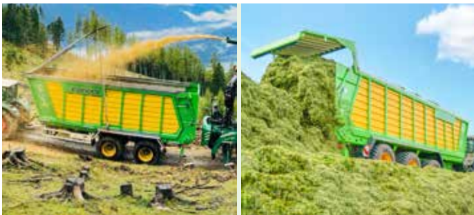
Silo-SPACE2 (4 Modelle) Kastenvolumen: 44 bis 61,18 m 3 DIN Nutzlast: 22 bis 28 t Zwei- / Dreiachser