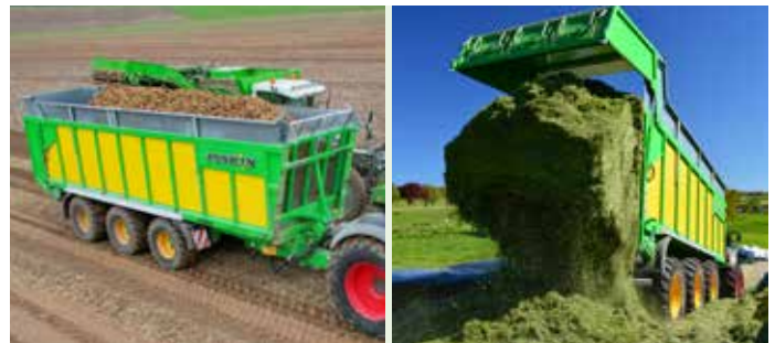
Drakkar (10 Modelle) Kastenvolumen: 23 bis 54 m 3 DIN Nutzlast: 18 bis 28 t Zwei- / Dreiachser