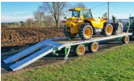
Gezogene WAGO-Loader (3 verzinkte Modelle) Nutzlast: 14 oder 21 t Länge: 8 oder 9,9 m 2/3 Achsen