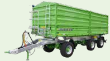
Tetra-CAP & Tetra-SPACE

3 bis 14 t • 1,9 bis 19,36 m 3 DIN Länge: 2,86 bis 6 m Höhe: 0,4 bis 1,6 m