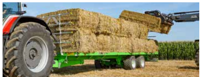
Aufgesattelter WAGO (10 lackierte oder verzinkte Modelle) Nutzlast: 7 bis 24 t Länge: 6 bis 11,7 m Ein- / Zwei- / Dreiachser