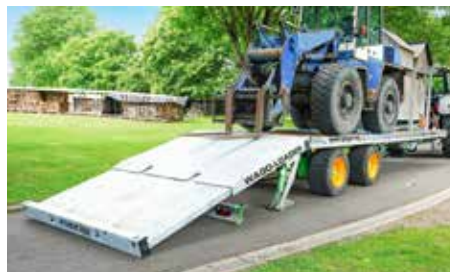
Aufgesattelte WAGO-Loader (4 verzinkte Modelle) Nutzlast: 14 oder 24 t Länge: 8 bis 10 m Zwei- / Dreiachser