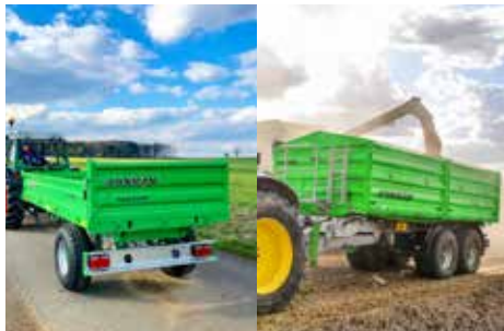
Trans-EX & Delta-CAP