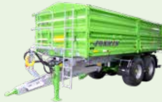
Trans-EX & Delta-CAP

9 bis 30 t • 5,1 bis 17,3 m 3 DIN Länge (oben): 4,6 bis 7,52 m Höhe: 0,5 bis 1,05 m