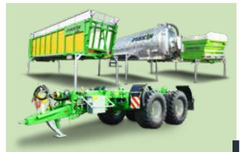
CARGO Fahrgestell + Werkzeuge