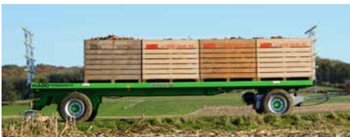
Gezogener WAGO (9 Modelle, lackiert oder verzinkt) Nutzlast: 10 bis 21 t Länge: 8 bis 11,7 m 2/3 Achsen