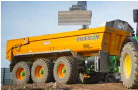
Trans-KTP (17 bis 34 t)