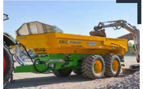
Trans-KTP (9 bis 15 t)