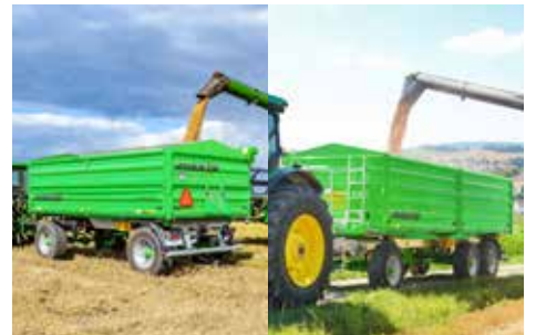
Tetra-CAP & Tetra-SPACE