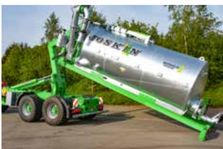
Cargo-LIFT CL (6 Modelle) Technische Nutzlast: 12 bis 30 t Länge des Containers: 3,2 bis 7,445 m Zwei- / Dreiachser