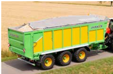
Drakkar (vielseitiger Transportwagen)