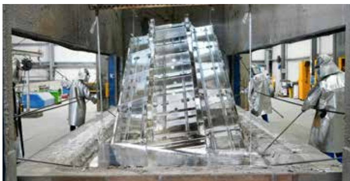
Doświadczenie w obróbce powierzchni (cynkowanie i malowanie) będące gwarancją jakości