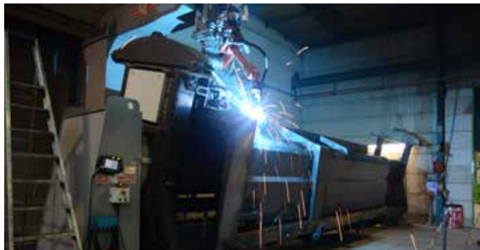
Doświadczenie w automatyzacji produkcji