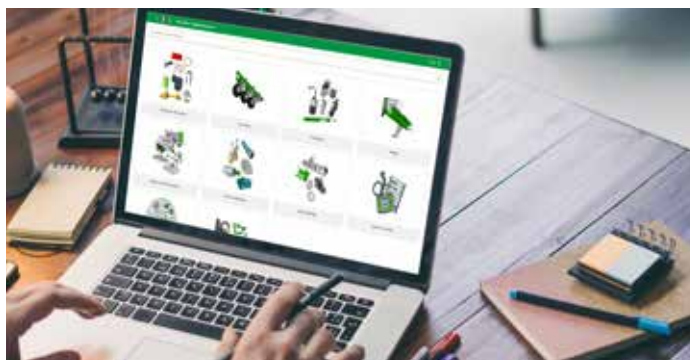
Doświadczenie w wykorzystaniu narzędzi IT do bieżących kontaktów z dilerami