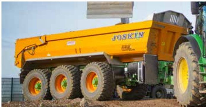
Doświadczenie w transporcie rolniczym i budowlanym