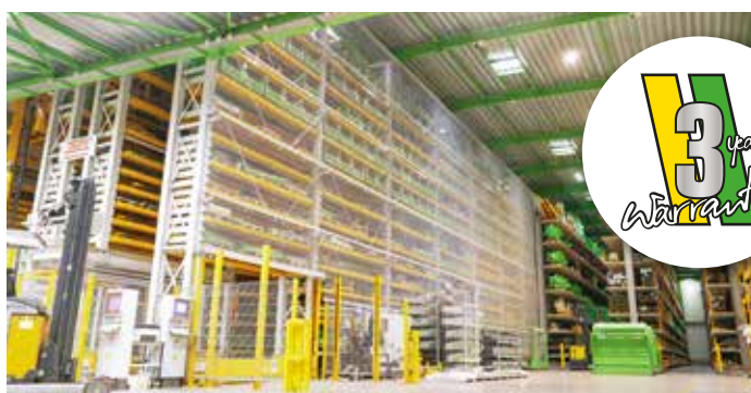
Doświadczenie w usługach serwisowych, w tym 3-letnia gwarancja i stały zapas części zamiennych