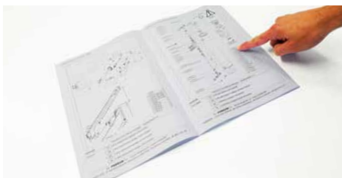
Doświadczenie w zaopatrywaniu w części zamienne dzięki indywidualnej książce części generowanej automatycznie według numeru ramy.