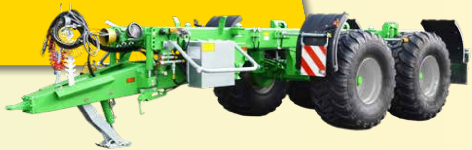
Ferti-CARGO (3 modellen)

Lengte chassis: 6 m (20 t) of 7,1 m (28 t) Dubbel-/Drieasser