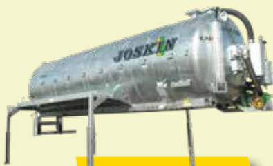
Vacu-CARGO (4 modelos)