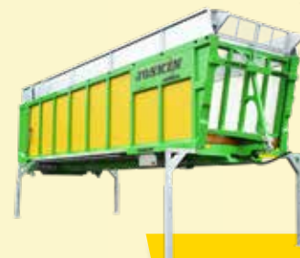
Drakkar-CARGO (4 modelos)