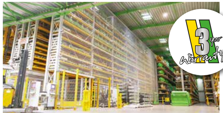
Die Expertise des Kundendienstes mit 3 Jahren Garantie und einem ständigen Lagerbestand an Ersatzteilen