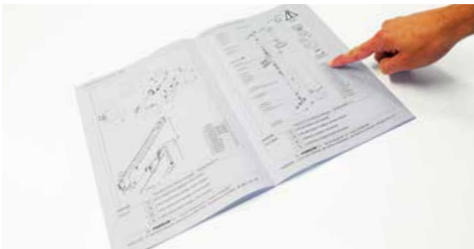
Die Kontrolle über Ersatzteile mit einem automatisch erstellten personalisiertem Ersatzteibuch mit der Fahrgestellnummer