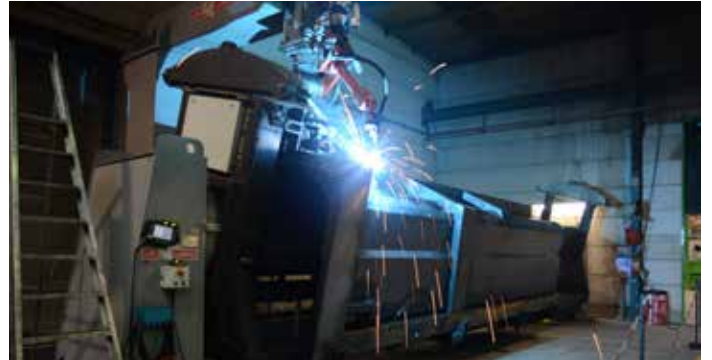
Die Expertise der automatischen Fertigung