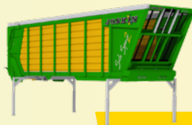
Silo-CARGO (2 Modelle)