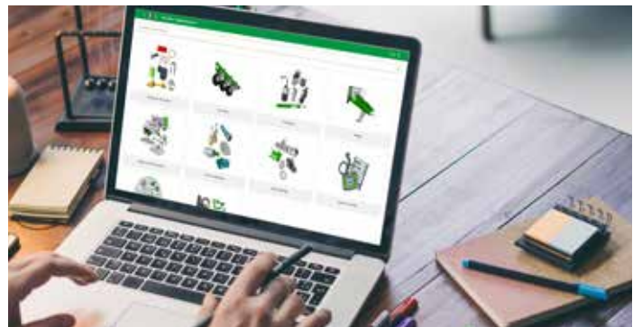
Die Expertise der Informatik für eine ständige und einfache Nachverfolgbarkeit mit unseren Händlern